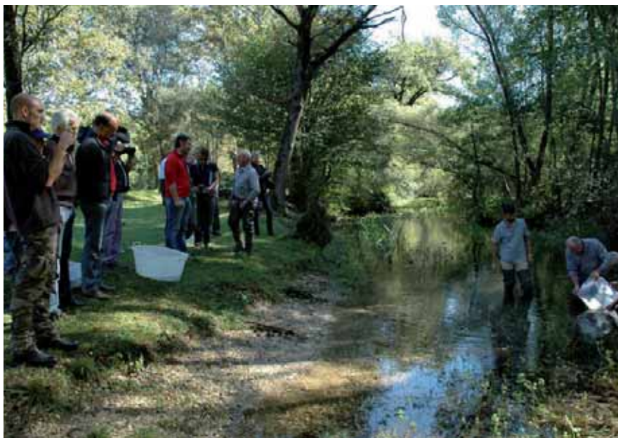
Foto 1. Operazione di rilascio di esemplari di A. pallipes presso il Parco delle Risorgive di Cordero (UD), (foto: Paolo Cè, Ente Tutela e Pesca del Friuli Venezia Giulia).

Gli obiettivi del progetto sono essenzialmente quelli di arrestare la diffusione del gambero rosso della Louisiana, di rafforzare le popolazioni di gamberi di fiume del Friuli Venezia Giulia e di elaborare una normativa che consenta di gestire il problema della presenza di questa specie alloctona e invasiva.