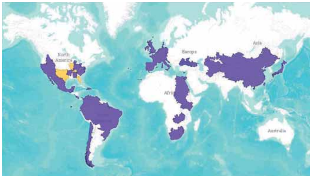
Figura 1. Distribuzione di Procambarus clarkii . L'areale originario è indicato in giallo, in viola l'areale di introduzione ( http://maps.iucnredlist ).

- chela sviluppata e rugosa, margini interni del dito fisso e di quello mobile curvi e con denti;